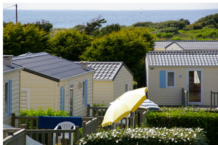
En photo: le village du CCE de la Société Générale, au Croisic

Son contenu polémique accumule des chiffres faux « Fable des 4 milliards d'argent publics versés aux syndicats » ( Libération du 24 mai 2016), il est néanmoins à l'origine d'une proposition de Loi sur la publication des comptes des CE.