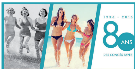
les 80 ans des congés payés (illustration SalonsCE - Comexposium)

Destination Partage a joué le jeu de la complémentarité, comme les autres exposants, privilégiant la complémentarité et l'échange de contacts dans une démarche partenariale.