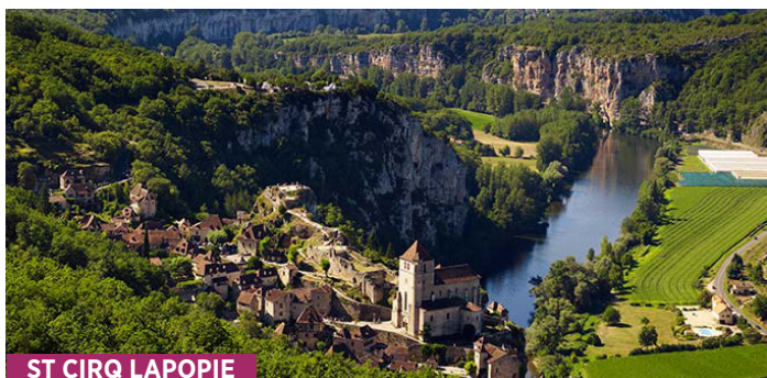
ST CIRQ LAPIOIE